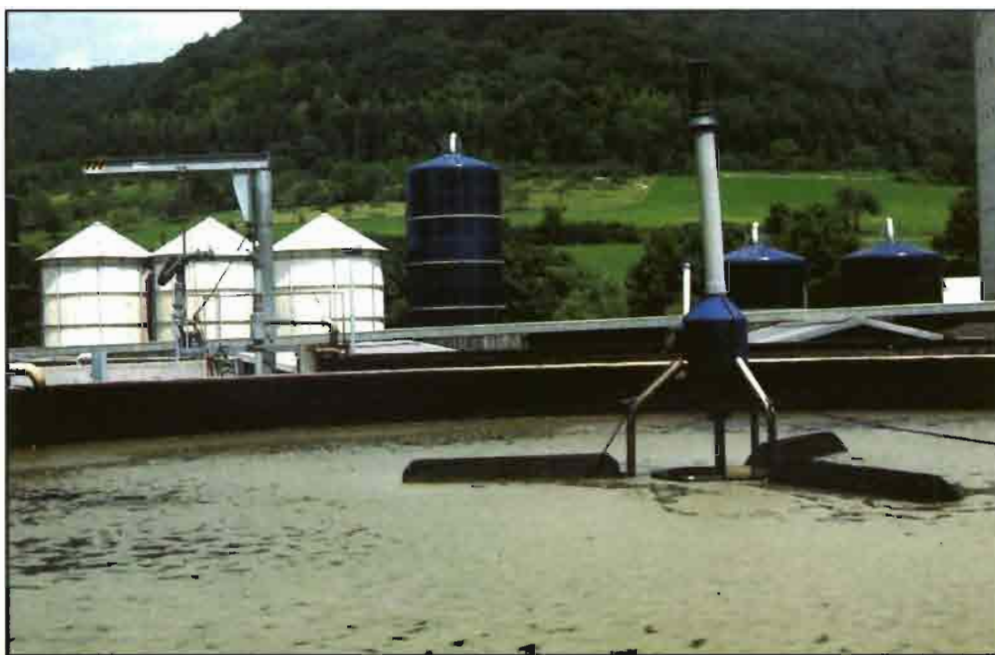
El tratamiento de estiércoles está regulado por la Ley 10/98.

Respecto a la gestión de los cadáveres, el RD 324/2000 presenta la necesidad de que las explotaciones dispongan de un sistema de recogida o tratamiento y eliminación de éstos, con suficientes garantías