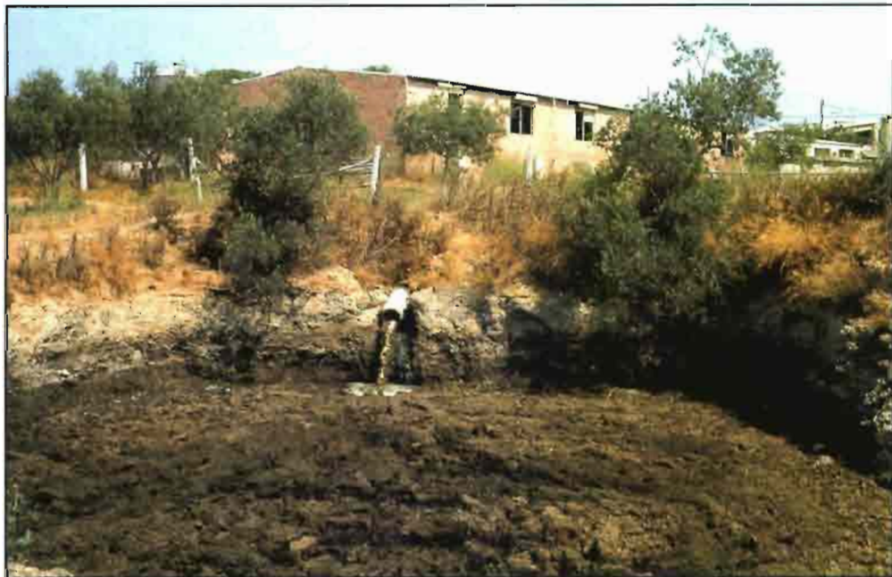
Anualmente se producen unos 39 millones de toneladas de purines porcinos.

En la actualidad, en España, el Real Decreto 324/2000 (BOE nº 58 de 3 de marzo) donde se establecen las normas básicas de ordenación de las explotaciones porcinas presenta el marco para la